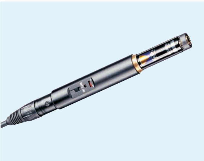
Das abgebildete Kabel gehört nicht zum Lieferumfang.

Der Speiseadapter K6 für Batterie- und Phantomspeisung ist der Grundbaustein des professionellen Kondensator-Mikrofonmodul-Systems K6 modular. Durch die Kombination des K6 mit unterschiedlichen, aufschraubbaren Kondensator-Mikrofonmodulen entstehen Mikrofone mit unterschiedlichen Richtcharakteristiken. Darüber hinaus dient das K6 auch als Griffstück. Oberfläche: mattschwarz eloxiert, kratzfest.