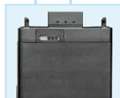
Akkupack BA 250, 3 Zellen, für SK 50 und SK 250