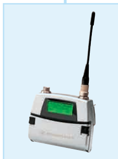
Sender SK 5212, umschaltbar, typ. 50 mW/10 mW