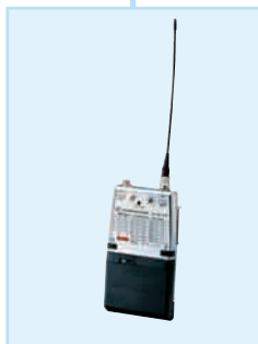
Sender SK 250, 250 mW HF-Ausgangsleistung, VHF- und UHF-Versionen