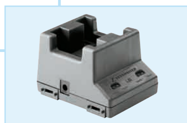
Ladegerät L 50, lädt 2 Senderakkupacks