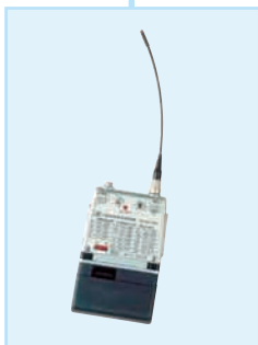
Sender SK 50, 50 mW HF-Ausgangsleistung, VHF- und UHF- Versionen