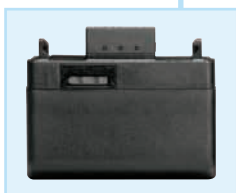
Batteriepack B 50, 2 Zellen, nur für SK 50