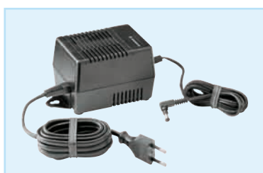
Netzteil NT 50, versorgt bis zu 4 Ladegeräte