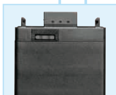
Batteriepack B 250, 3 Zellen, für SK und SK 250