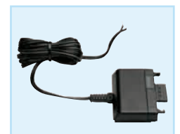
Speiseadapter DCA 50, Anschluß der Sender SK 50 und SK 250 an externe 8-30 V AC/DC-Quellen