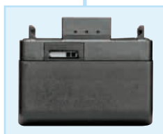
Akkupack BA 50, 2 Zellen, nur für SK 50