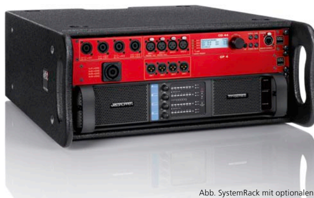
Abb. SystemRack mit optionalen RackRahmen

Der Vorteil des K&F SytemRacks* liegt auf der Hand, schnelles und intuitives Arbeiten. Mit wenigen Handgriffen steht die Basis für kreatives Arbeiten zur Verfügung. Dies ist unser Beitrag für alle die sich dem guten Ton verschrieben haben. Ganz im Sinne der Kling & Freitag Philosophie.